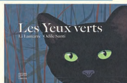
Les Yeux verts