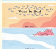
Vers le Sud Max Estes