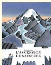
L'Ascension de Saussure Pierre Zenzius Rouergue

Li Lamarre Odile Santi Courtes et Longues