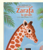
L'histoire vraie de Zarafa la girafe F. Bernard, Julie Fauques Nathan