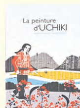
La peinture d'Uchiki Wodarczyk, Xavière Broncard A Pas de Loups