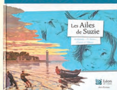
Les ailes de Suzie Hélène Kerillis, Xavière Devos Léon Stories