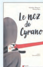
Le nez de Cyrano Géraldine Maincent Flammarion Jeunesse