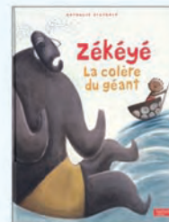
Zékéyé La colère du géant Nathalie Dieterlé Hachette