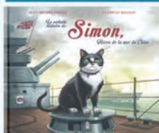
Simon, héros de la mer de Chine Jean-Michel Derex Pierre de Taillac