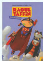
Raoul Taffin, Super héros Gérard Moncomble Milan