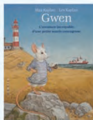
Gwen, la petite souris courageuse Kev Kaplan Minedition