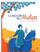
La ballade de Mulan Clémence Pollet Chun-Liang Yeh HongFei