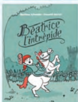
Béatrice l'intrepide Mathieu Sylvander Perceval Barrier Ecole des loisirs