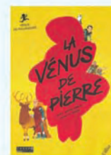
La Vénus de pierre Alice Brière-Haquet Laurent Simon Elan Vert